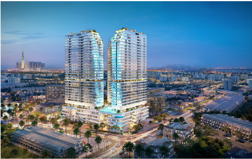
Dự án sở hữu vị trí tâm điểm kết nối giao thương liên vùng

Sở hữu vị trí trọng điểm kết nối giao thông liên vùng với hệ thống đường bộ, đường thủy, Metro và dễ dàng kết nối với cảng hàng không Tân Sơn Nhất, Thủ Đức đang trở thành trung tâm kinh tế - tài chính - giáo dục của toàn khu vực. Không chỉ quy tụ hàng loạt khu chế xuất, khu công nghiệp quy mô, đây còn là khu vực tập trung các trung tâm nghiên cứu ứng dụng công nghệ cao và là vùng đất hội tụ tinh hoa giáo dục hiện đại với hệ thống các trường đại học hàng đầu. Lấy kinh tế tri thức, sáng tạo làm trọng tâm và đầu tư từ gốc cho nghiên cứu, chuyển giao công nghệ tiên tiến, Thủ Đức trở thành mảnh đất thu hút nguồn nhân lực chất lượng cao của khu vực Đông Nam Bộ nói riêng và cả nước nói chung.