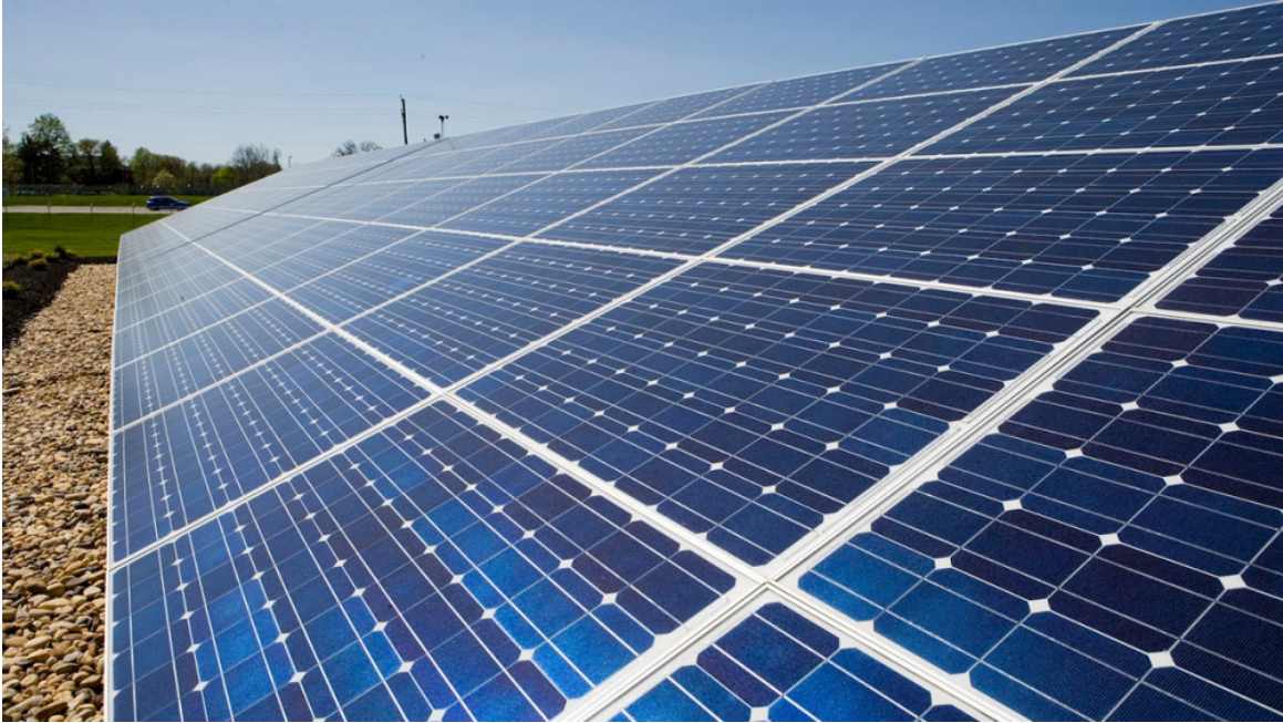
Bamboo Capital hoàn tất tăng vốn lên 2.034 tỷ đồng

Ngày 16/3, CTCP Bamboo Capital (Mã: BCG) đã công bố thông tin về việc phát hành cổ phiếu ra công chúng cho cổ đông hiện hữu và sửa đổi vốn điều lệ của Công ty.