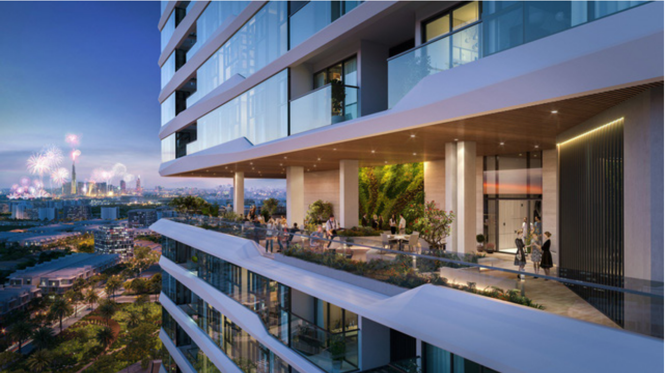
BCG Land mang đến những sản phẩm thực – giá trị thực cho khách hàng

Trải qua năm 2020 đầy biến động, thị trường bất động sản đã có những thay đổi rõ nét để đáp ứng với sự dịch chuyển nhu cầu của khách hàng. Nếu như trước đây, vị trí là yếu tố tiên quyết có thể tác động 90% tới giá trị bất động sản cũng như quyết định "xuống tiền" của khách hàng thì nay những "giá trị mềm" như hệ sinh thái các tiện ích, dịch vụ và cảnh quan, hệ thống giao thông đồng bộ... đã vươn lên chiếm thế cân bằng với yếu tố vị trí.