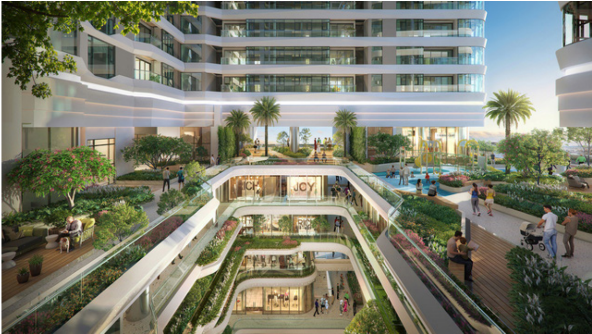
King Crown Infinity – một chốn bình yên đi về thư thái sau những bận rộn lo toan

Cùng với đó là những chuẩn mực thiết kế cũng như trang thiết bị, nội thất bên trong mỗi căn hộ tại King Crown Infinity đều mang tiêu chuẩn cao cấp của một căn hộ hạng A để khách hàng thực sự cảm nhận được sự thỏa mãn khi sống và làm việc trong một không gian xứng tầm.