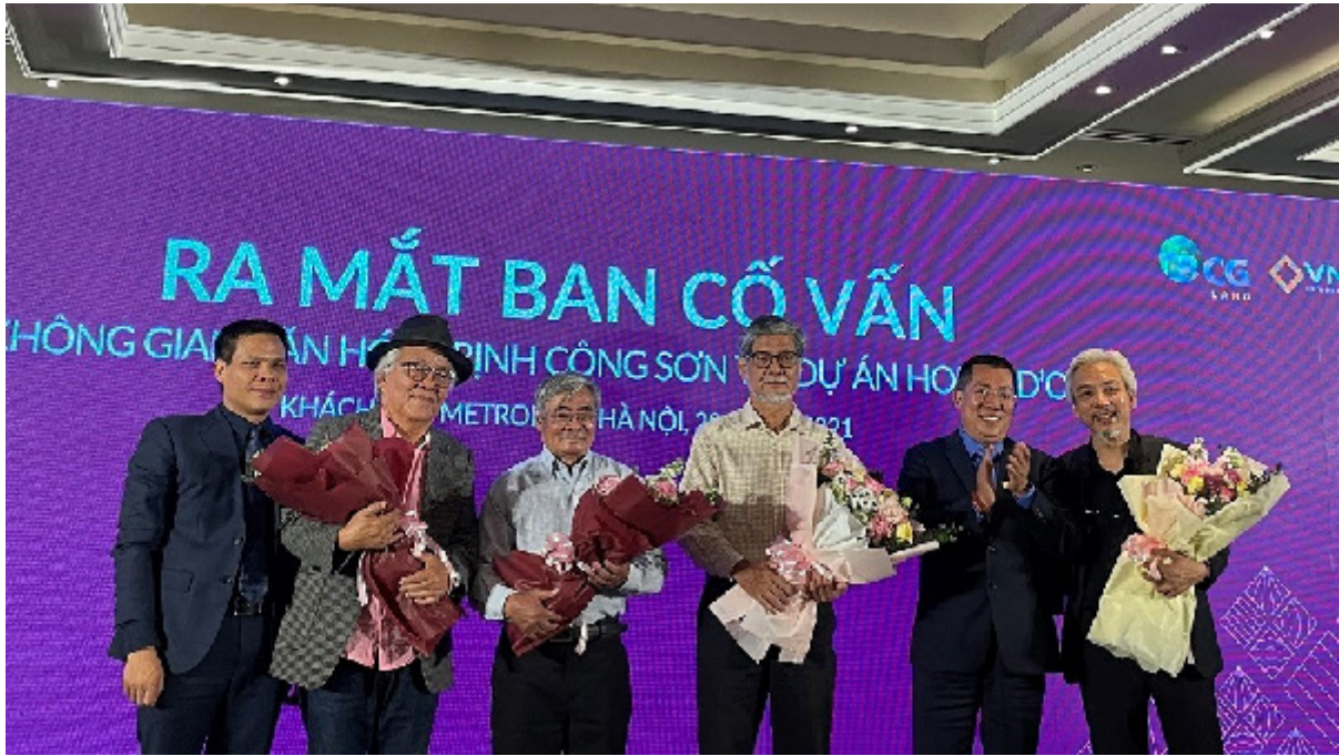
Ra mắt ban cố vấn "Không gian văn hóa Trịnh Công Sơn"

Cũng trong sự kiện, Công ty TNHH Du lịch Sinh thái Cồn Bắp – Chủ đầu tư dự án Hoian d’Or cùng đại diện gia đình cố nhạc sĩ đã ký kết hợp tác xây dựng không gian văn hoá Trịnh Công Sơn tại Hội An. Bên cạnh không gian trưng bày các tư liệu về cuộc đời nhạc sĩ Trịnh Công Sơn, trên quy mô 24,8ha với vị trí cận kề ngay phố cổ Hội An – di sản văn hóa thế giới đã được Unesco công nhận, công trình còn có thêm không gian trưng bày gồm Chu Đậu, không gian trưng bày nhạc cụ dân tộc và những hình ảnh Hội An xưa – nay.