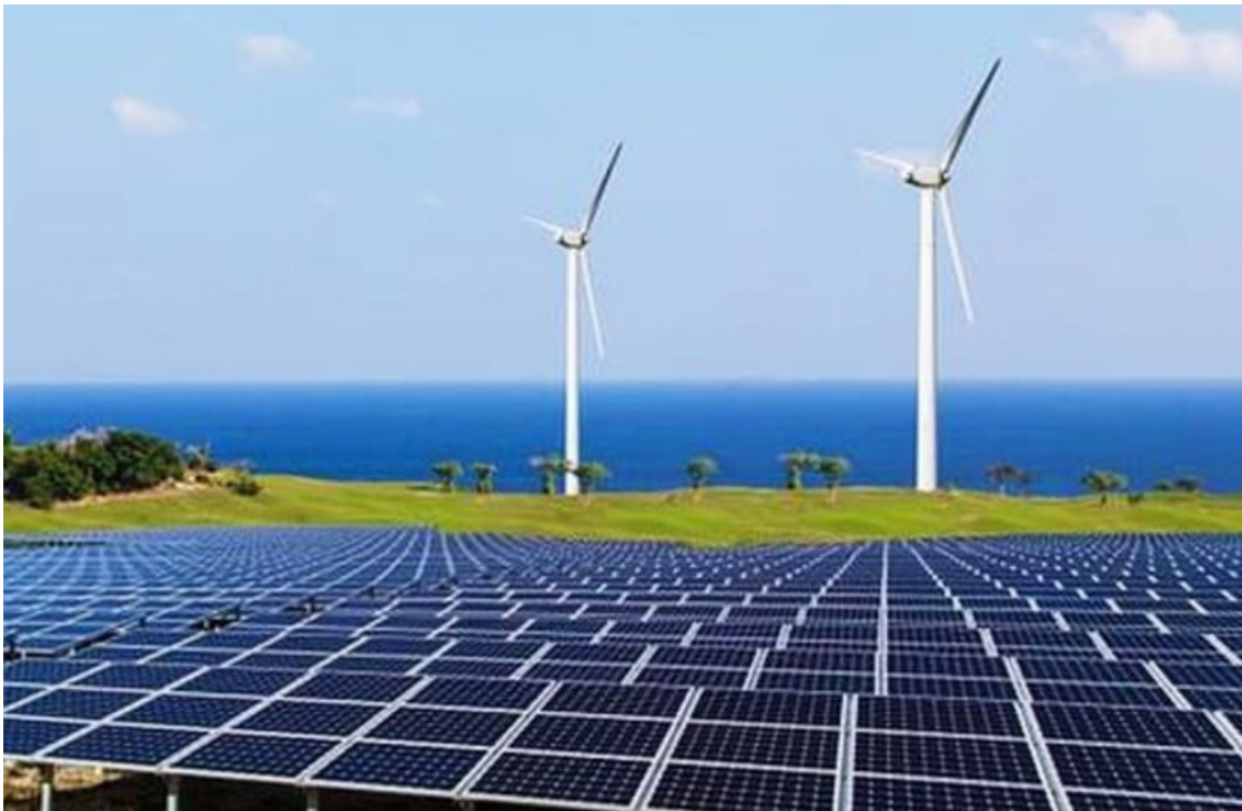
Bamboo Capital (BCG) lập thêm công ty con mảng điện

Bamboo Capital dự kiến góp 99 tỷ đồng, tương đương 99% vốn điều lệ, tại pháp nhân mới là Công ty Cổ phần BCG LNGPower. Được biết, doanh nghiệp thành viên này có vốn điều lệ 100 tỷ đồng, hoạt động chủ yếu trong lĩnh vực xây dựng công trình điện, sản xuất và truyền tải điện.