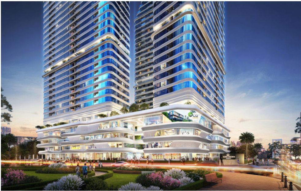
Dự án sở hữu vị trí tâm điểm kết nối giao thương liên vùng

Là tân binh mới gia nhập thị trường bất động sản, BCG Land đang vươn lên với sứ mệnh kiến tạo những giá trị thực cho khách hàng song hành với tầm nhìn bảo tồn và phát triển những nét đẹp lịch sử và văn hóa.