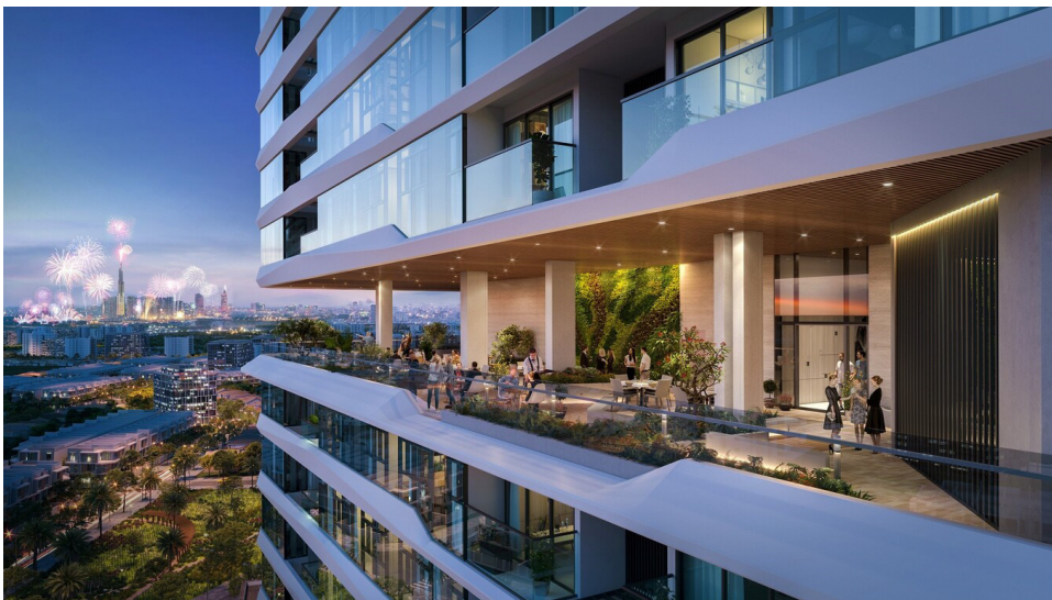
Khu phức hợp mang đến chuẩn mực và phong cách sống đẳng cấp cho cư dân thành phố mới.

Với hệ thống các tầng thương mại hiện đại, King Crown Infinity cũng hứa hẹn trở thành tâm điểm kết nối cộng đồng doanh nhân trí thức đẳng cấp trong khu vực, giao thoa và lan tỏa các giá trị, văn hóa kinh doanh bền vững, góp phần kiến tạo biểu tượng mới của thành phố Thủ Đức.