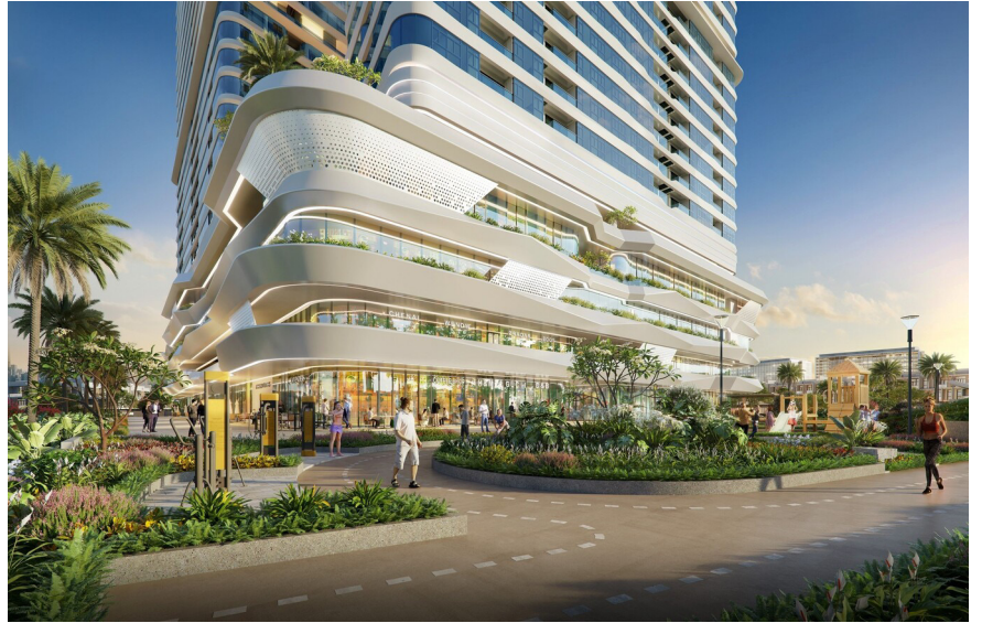
Dự án kiến tạo không gian an cư cho cộng đồng cư dân ưu tú.

Nối tiếp di sản văn hóa giáo dục, khi Thủ Đức còn là quận có đầy đủ các trường từ cấp tiểu học đến đại học với cơ sở vật chất hiện đại, những công dân nhí ở King Crown Infinity có thể học tập trong hệ thống giáo dục chuẩn mực từ hệ thống trường học, viện nghiên cứu danh giá như mạng lưới trường mầm non và phổ thông liên cấp chuẩn quốc tế Vinschool, Đại học Fulbright, Làng Đại học Quốc gia TP HCM - Top 750 nhóm trường đại học tốt nhất thế giới. Tất cả tạo thành nền tảng vững vàng để những mầm mon tương lai của đất nước an tâm, an toàn phát triển tri thức toàn diện.